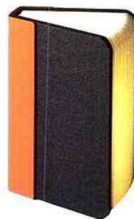
Mini Lumio, en tissu et papier, H 14 cm * 150 € * Max Gunawan chez Merci