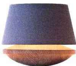
Kjell, bois et lin, H 25,5 cm * 434,90 € * Domus chez Luminaire