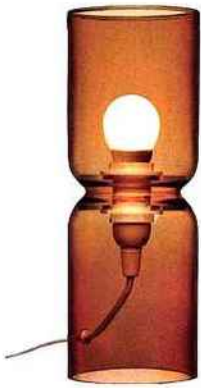
Lanterne en verre, H 25 cm * 169 € * Iittala