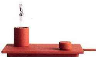
Control, en métal, H 21 cm * 119 € * Muuto chez Voltex