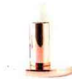
Pom Pom, en verre soufflé et métal, H 20,5 cm * 198 € * Calligaris