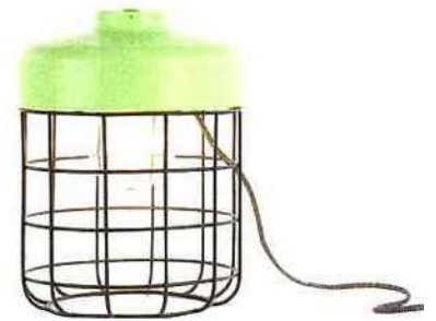
Arthur, en acier, H 31 cm * 49 € * Made