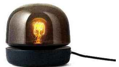
Stone, en céramique et verre, H 19 cm * 229 € * Menu chez Lightonline