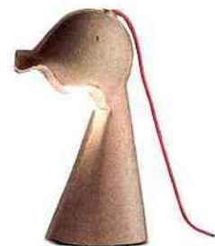
Eggs of Columbus, en carton, H 41 cm * 36,90 € * Seletti chez Decoclic