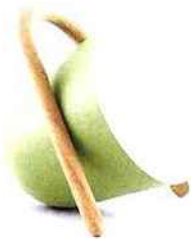
Elmetta, métal et bois, H 25 cm * 220 € * Tommaso Caldera chez Incipit