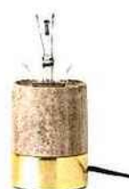
En marbre et laiton, H 11 cm * 179 € * Bloomingville chez Minimal