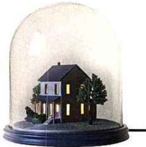
En verre et résine, H 26,8 cm * 240 € * Seletti chez Made in Design