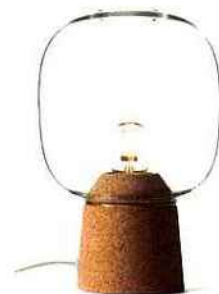
Picia, en verre et liège, H 23 cm * 141 € * Enrico Zanolla chez The Cool Republic